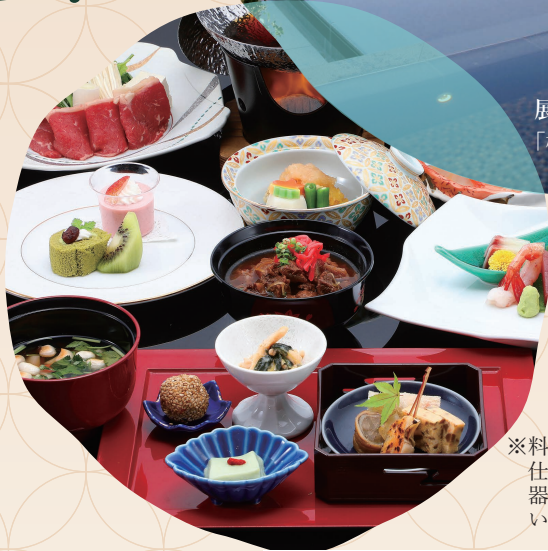
展望露天風呂 「棚雲(たなぐも)の湯」

※料理写真は一例です。 仕入れの都合上、料理内容、 器が変更になる場合がございます。