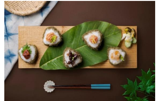
ご当地おにぎり (イメージです)