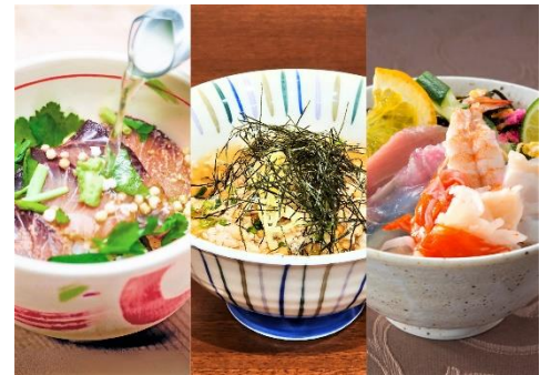
各施設のご当地茶漬け (イメージです)