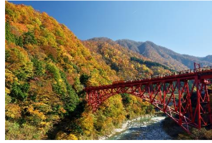
黒部「黒部峡谷トロッコ電車」