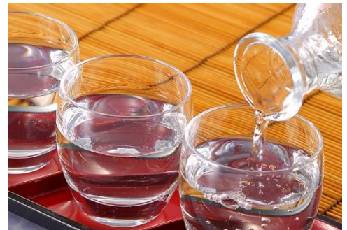
3地域の日本酒飲み比べセット (イメージ)