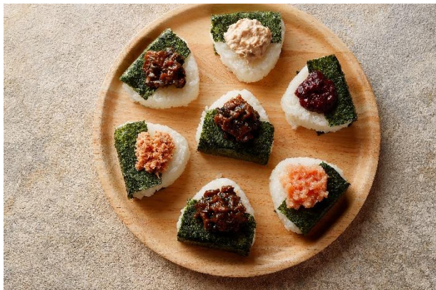
朝食ご当地おにぎり提供（※イメージです）

ORIX HOTELS & RESORTS がお届けする「旅館コレクション」ブランドの「函館・湯の川温泉 ホテル万惣」（北海道函館市、以下 ホテル万惣）、「会津・東山温泉 御宿 東鳳」（福島県会津若松市、以下 御宿 東鳳）、「黒部・宇奈月温泉 やまのは」（富山県黒部市、以下 やまのは）は、各地域の秋の味覚「新米」が楽しめる合同企画第4弾「深まる秋、とれたて新米を味わう旅」を2024年10月31日（木）より開催します。あわせて、本日より宿泊プランの予約受付を開始します。