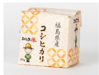
「コシヒカリ」新米2合パック